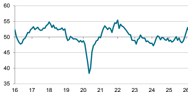
S&Pグローバル 日本製造業PMI 季節調整済み指数、>50 = 前月比で改善

本調査データ集計期間: 2026年4月9日~4月23日 出所: S&PグローバルPMI。©2026 S&P Global