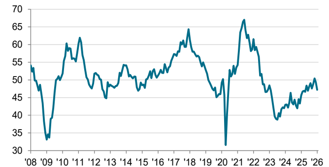
UniCredit Bank Austria Einkaufsmanagerindex sb. >50 = Wachstum im Vormonatsvergleich

Ausschlaggebend hierfür war der Mangel an Neuaufträgen. So fielen die zweiten Auftragsverluste in Folge so kräftig aus wie zuletzt im Juni 2025. Maßgeblich dazu beigetragen haben die gravierendsten Einbußen beim Auslandsgeschäft seit sieben Monaten.