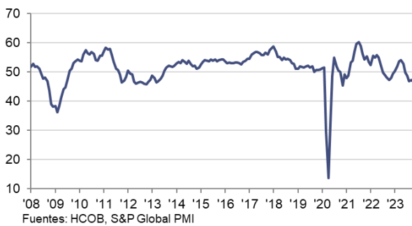
Índice HCOB PMI Compuesto de Actividad Total Zona Euro c.v.e., >50 = crecimiento desde el mes anterior