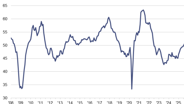
HCOB Einkaufsmanagerindex Industrie Eurozone sb, >50 = Wachstum im Vormonatsvergleich