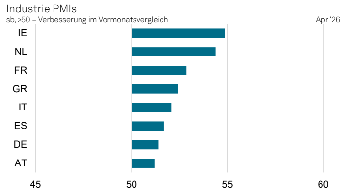
Legende: DE = Deutschland, FR = Frankreich, IT = Italien, ES = Spanien, NL = Niederlande, AT = Österreich, IE = Irland, GR = Griechenland.