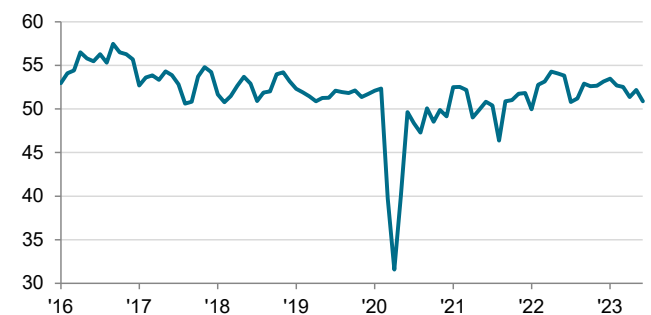
Philippines Manufacturing PMI sa, >50 = paglago simula noong nakaraang buwan

Ang data ay nakolekta noong 12-23 Hunyo 2023.