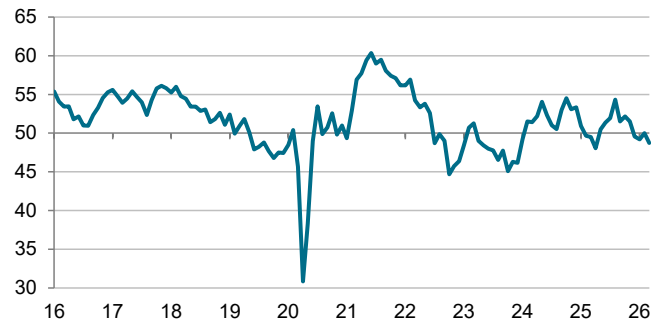
S&P Global Índice PMI Sector Manufacturero de España Índice, c.v.e., >50 = mejora frente al mes anterior

Los datos se recopilaban entre el 12 y el 24 de marzo de 2026.