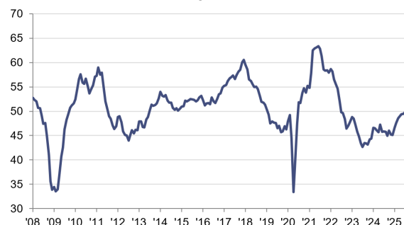
HCQB Eurozone Industrie PMI sb, >50 = Wachstum im Vormonatsvergleich