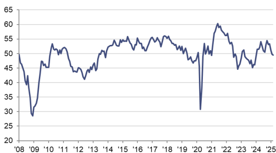
HCOB PMI Sector Manufacturero Español c.v.e., >50 = mejora desde el mes anterior