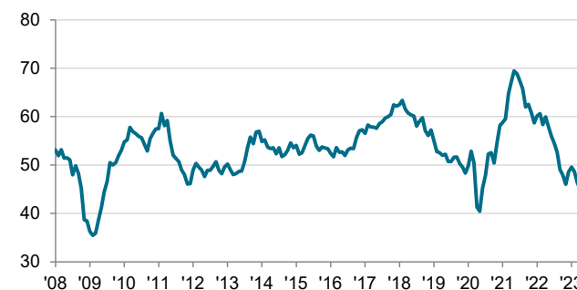
PMI Productiesector Nederland seizoensmatig aangepast, >50 = verbetering t.o.v. de vorige maand

De gegevens werden verzameld van 12 - 22 juni 2023.