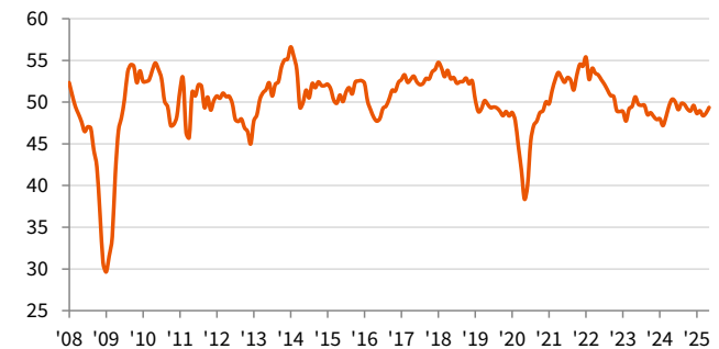
auじぶん銀行 日本製造業PMI 季節調整済み、>50 = 前月比で改善