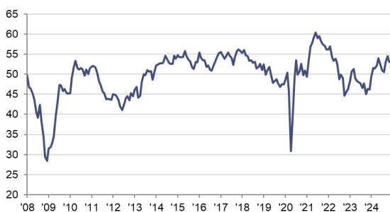
HCOB PMI Sector Manufacturero Español c.v.e., >50 = mejora desde el mes anterior