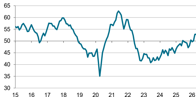
Výrobní PMI České republiky od S&P Global Index, s.o., >50 = zlepšení m/m

Někteří účastníci v průzkumu také zmiňovali, že klienti vzhledem k větší nejistotě váhají se zadáváním zakázek, a to se odrazilo na míře jejich růstu. Nové zakázky v květnu vzrostly mírně a nejslabším tempem v aktuální tříměsíční řadě expanze. Jejich růst podpořil větší zájem ze zahraničí, ale i ten byl mírnější.