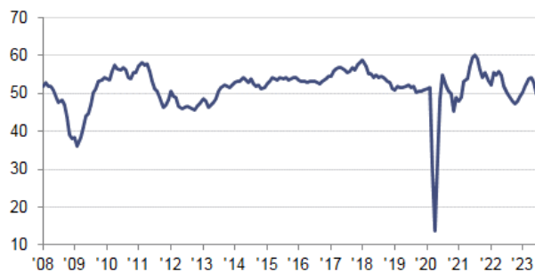
Indice HCOB PMI della Produzione Composita dell'Eurozona dati destagionalizzati >50 = crescita rispetto al mese precedente