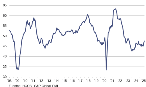
HCOB PMI Sector Manufacturero de la Zona Euro c.v.e., >50 = mejora desde el mes anterior