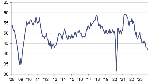
Indice PMI HCOB de l'industrie manufacturière en France cvs, >50 = amélioration par rapport au mois précédent