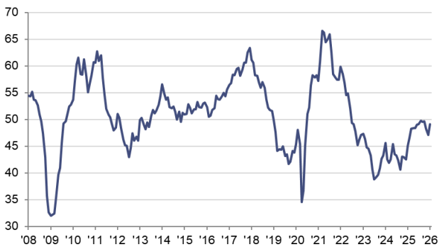
HCOB Einkaufsmanagerindex Deutschland sb, >50 = Verbesserung im Vormonatsvergleich