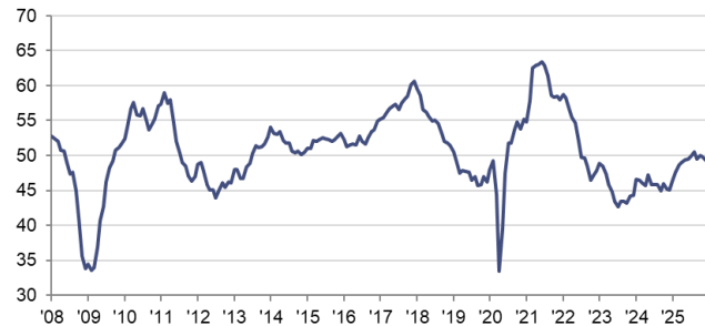
Indice PMI HCOB pour l'industrie manufacturière de la zone euro cvs, >50 = amélioration par rapport au mois précédent

Sources : HCOB, S&P Global PMI, Eurostat via S&P Global Market Intelligence.