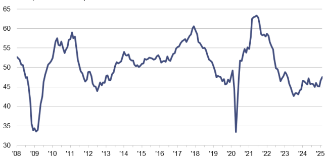
Indice PMI Manifatturiero Eurozona dati dest., >50 = cresc. rispetto al mese scorso