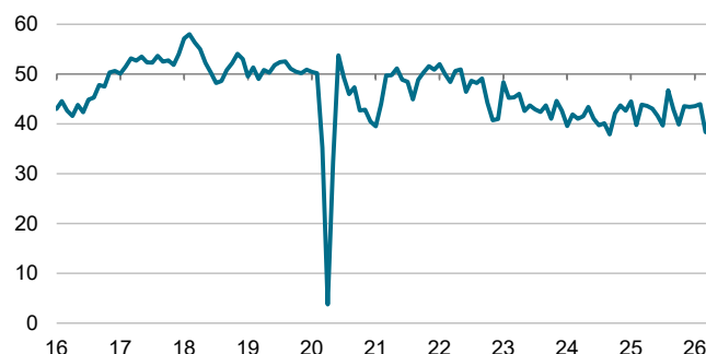
Indice PMI S&P Global de l'activité globale du secteur de la construction Indice, cvs >50 = croissance m/m

Données recueillies du 9 au 30 avril 2026.