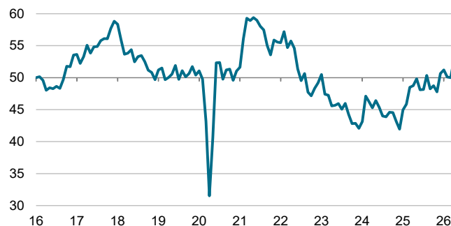
S&P Global PMI France - Industrie manufacturière Indice, cvs >50 = amélioration m/m

Les données ont été recueillies du 9 au 23 avril 2026.