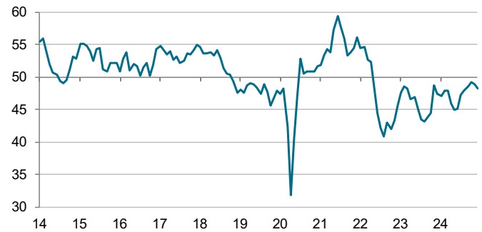
S&P Global PMI sektor przemysłowy wskaźnik sezonowo modyfikowany, > 50 = wzrost m/m

Dane zebrano w dniach 5 - 17 grudnia 2024.