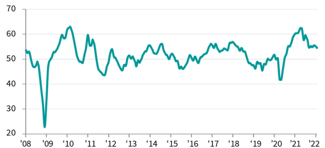
臺灣製造業 PMI >50 = 較上月好轉 (經季節調整)