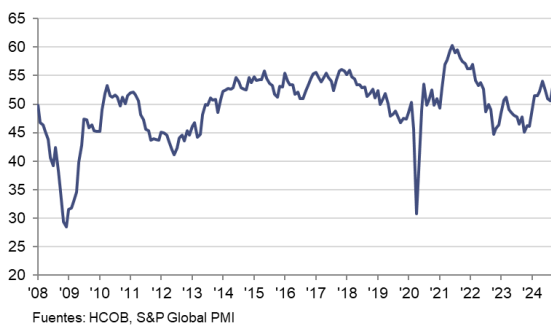
HCOB PMI Sector Manufacturero Español c.v.e., >50 = mejora desde el mes anterior