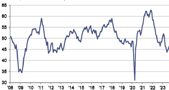
HCOB PMI Settore Manifatturiero Italiano Dato dest. >50 = crescita del mese precedente