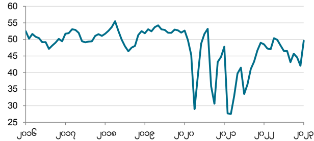
ဒေတာကို ၂၀၂၃ ခုနှစ် ဇန်နဝါရီ ၁၂ - ၂၃ ရက်များတွင် စုစည်းခဲ့သည်။

ရာသီအလိုက် ညွှန်ကိန်း >၅၀ =ယခင်လ နောက်ပိုင်း တိုးတက်ခဲ့