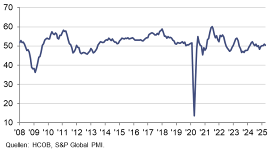
HCOB Composite PMI Eurozone sb, >50 = Wachstum im Vergleich zum Vormonat