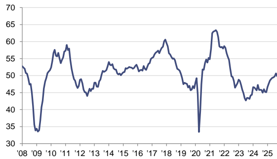
Indice HCOB PMI del Manifatturiero dell'eurozona dati destagionalizzati, >50 = miglioramento dal mese scorso