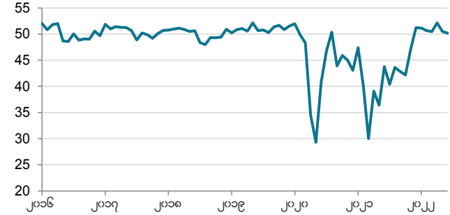
ရင်းမြစ်- S&P Global.

ရာသီအလိုက် ညွှန်နှုန်း >၅၀ =ယခင်လ နောက်ပိုင်းတိုးတက်လာခဲ့