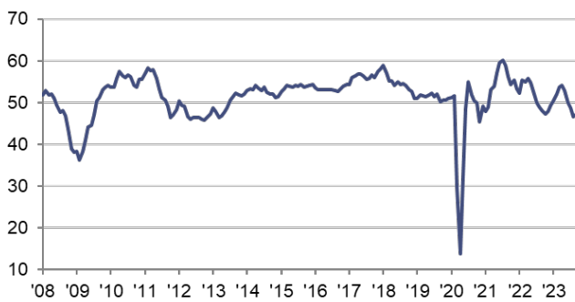
Indice PMI HCOB composite de l'activité globale cvs, >50 = croissance par rapport au mois précédent