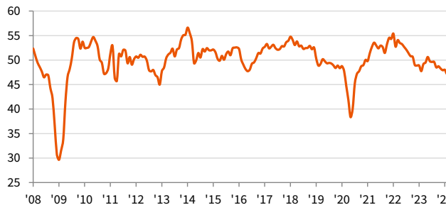
auじぶん銀行 日本製造業PMI 季節調整済み、>50 = 前月比で改善