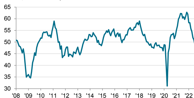
Settore Manifatturiero Italiano dati dest., > 50 = cresc. rispetto al mese scorso

Anche i volumi degli ordini dall'estero sono diminuiti nuovamente a settembre, con un calo marcato nonostante la leggera attenuazione su base mensile. I partecipanti all'indagine hanno rilevato la debolezza della domanda da parte dei clienti, commentando anche sui tassi di cambio sfavorevoli.