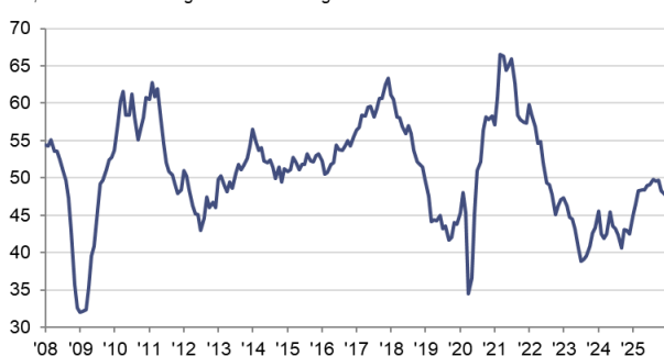
HCOB Flash Deutschland Industrie PMI sb, >50 = Verbesserung im Vormonatsvergleich