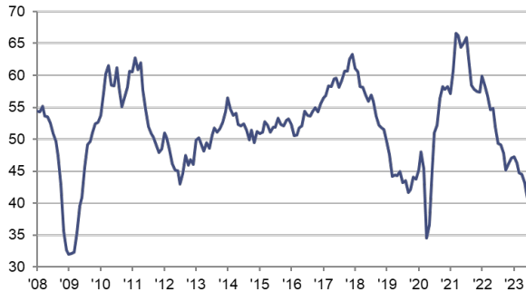
HCOB Einkaufsmanagerindex Deutschland sb, >50 = Verbesserung im Vormonatsvergleich