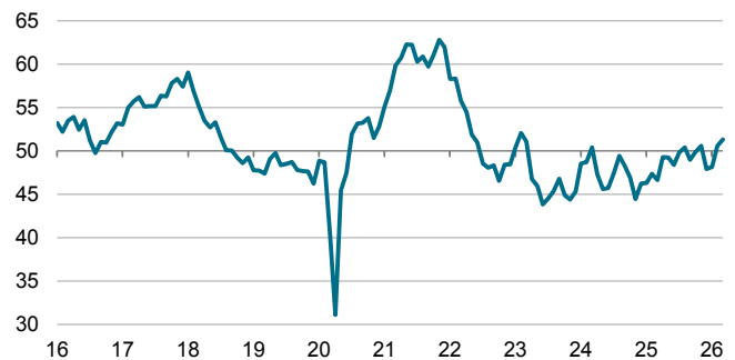
S&P Global PMI® Settore Manifatturiero in Italia dati dest., > 50 = crescita mensile

A marzo, in contrasto con la recente tendenza al ribasso durata oltre tre anni e mezzo, i livelli di acquisto delle aziende manifatturiere sono aumentati. Allo stesso tempo, per la prima volta in otto mesi, c'è stato un leggero aumento delle scorte delle materie prime e dei semi lavorati, poiché alcune aziende hanno cercato di incrementare le scorte in preparazione per possibili blocchi nella catena di fornitura.