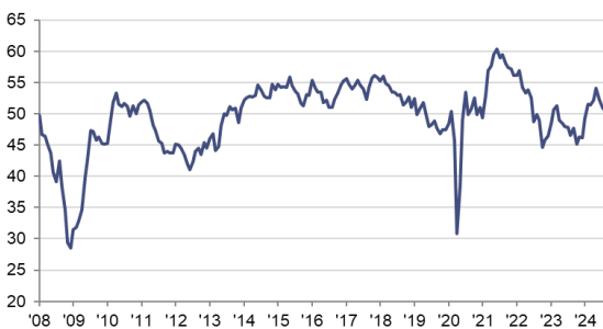
HCOB PMI Sector Manufacturero Español c.v.e., >50 = mejora desde el mes anterior