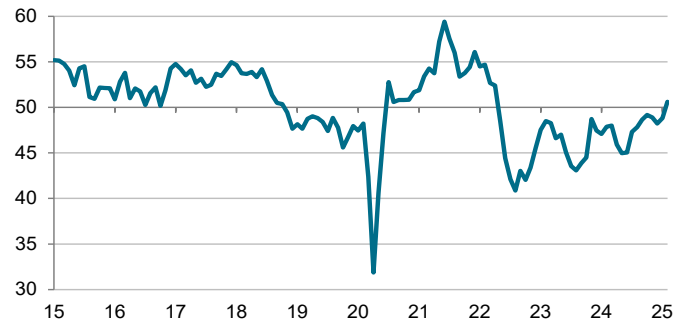
S&P Global PMI sektor przemysłowy wskaźnik sezonowo modyfikowany, > 50 = wzrost m/m

Dane zebrano w dniach 10-24 lutego 2025.