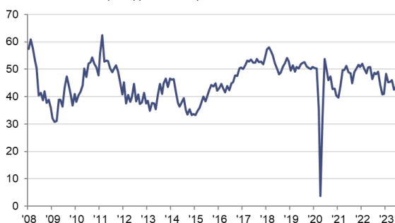
Indice HCOB de l'activité globale du secteur de la construction français CSV >50 = croissance par rapport au mois précédent