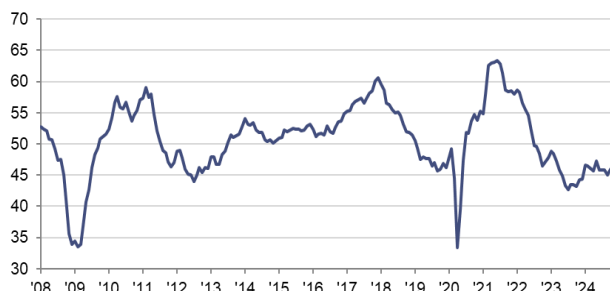
Indice PMI HCOB pour l'industrie manufacturière de la zone euro cvs, >50 = amélioration par rapport au mois précédent

Sources : HCOB, S&P Global PMI, Eurostat via S&P Global Market Intelligence.