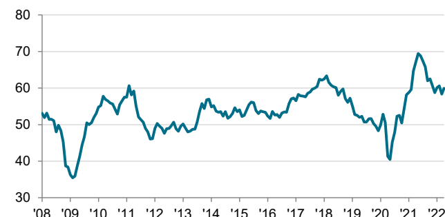
PMI Productiesector Nederland seizoensmatig aangepast, >50 = verbetering t.o.v. de vorige maand

De gegevens werden verzameld van 11 - 21 april 2022.