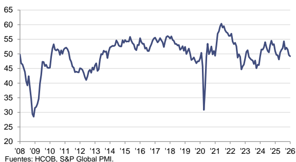
HCOB PMI Sector Manufacturero Español c.v.e., >50 = mejora desde el mes anterior