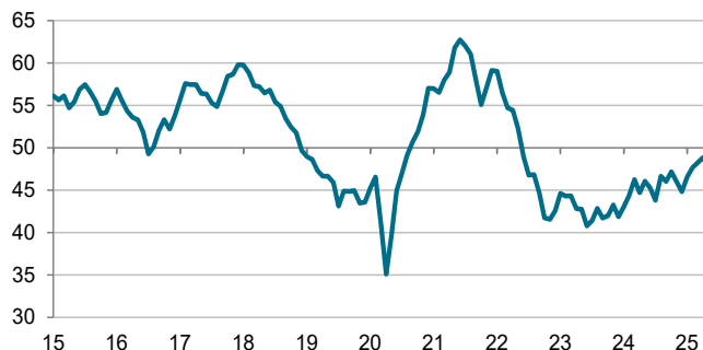
Výrobní PMI České republiky od S&P Global Index, s.o., >50 = zlepšení m/m

Podmínky byly utlumené, čeští výrobci v květnu přesto opět zvýšili své prodejní ceny, aby převedli vyšší náklady za zákazníky. Stejně jako u cen vstupů byl však trend inflace účtovaných