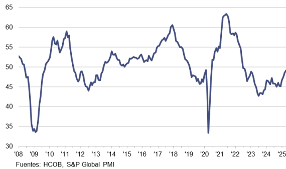
HCOB PMI Sector Manufacturero Zona Euro c.v.e., >50 = mejora desde el mes anterior