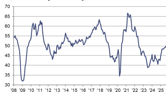
HCOB Einkaufsmanagerindex Deutschland sb, >50 = Verbesserung im Vormonatsvergleich