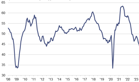
Indice PMI HCOB pour l'industrie manufacturière de la zone euro CVS, >50 = amélioration par rapport au mois précédent