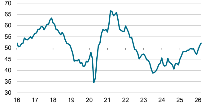
S&P Global Einkaufsmanagerindex™ Deutschland Index, saisonbereinigt, >50 = Verbesserung im Vormonatsvergleich

Die Verkaufspreise zogen ebenfalls an, da viele Unternehmen versuchten, einen Teil der gestiegenen Kosten an die Kunden weiterzugeben. Es war die höchste Steigerungsrate seit gut drei Jahren, die aber immer noch deutlich unter den Höchstwerten von 2021 und 2022 lag.