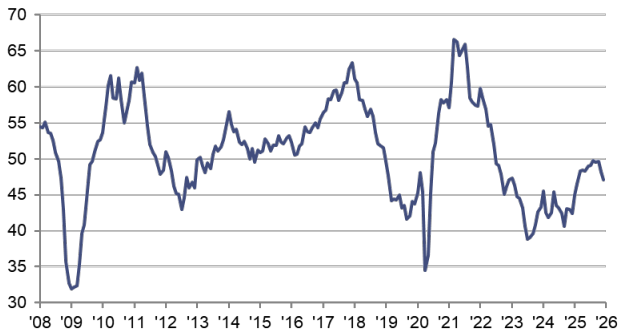
HCOB Einkaufsmanagerindex Deutschland sb, >50 = Verbesserung im Vormonatsvergleich