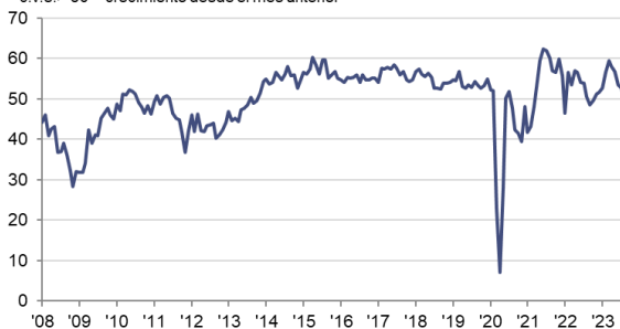
Índice HCOB PMI Actividad Comercial del Sector Servicios c.v.e. > 50 = crecimiento desde el mes anterior