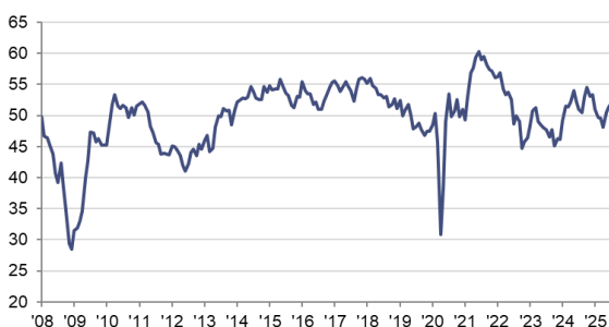
HCOB PMI Sector Manufacturero Español c.v.e., >50 = mejora desde el mes anterior