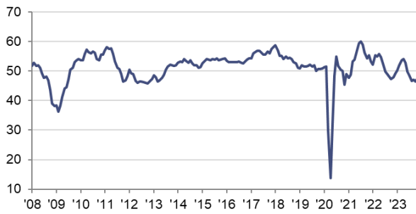
Índice HCOB PMI Compuesto de Actividad Total Zona Euro c.v.e., >50 = crecimiento desde el mes anterior